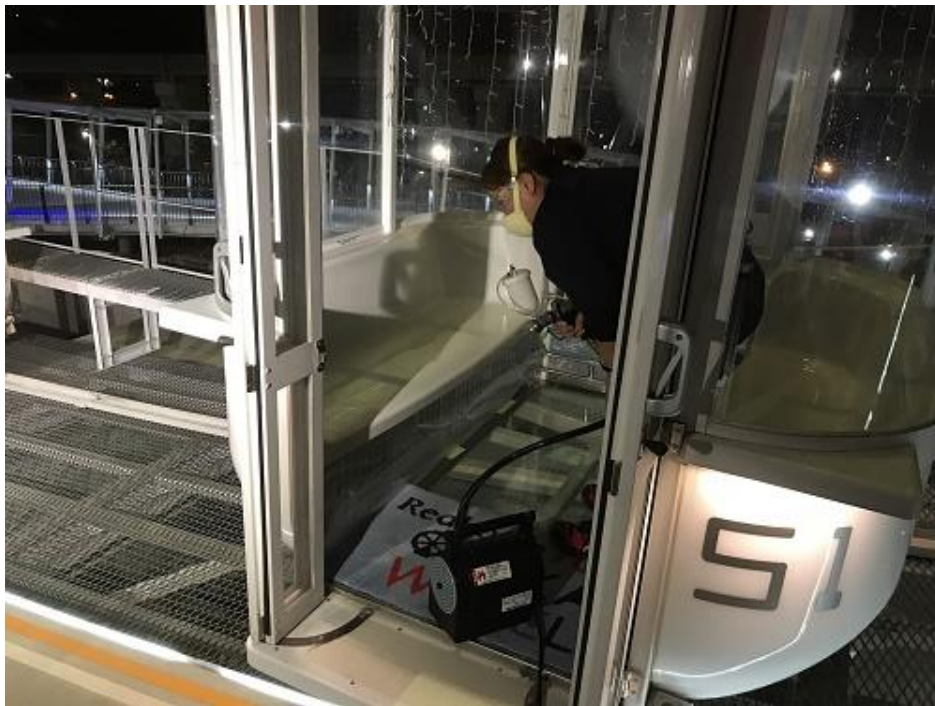
抗ウイルス抗菌コーティング(「レコナガード エアリフレッシュ」) 観覧車の施工の様子