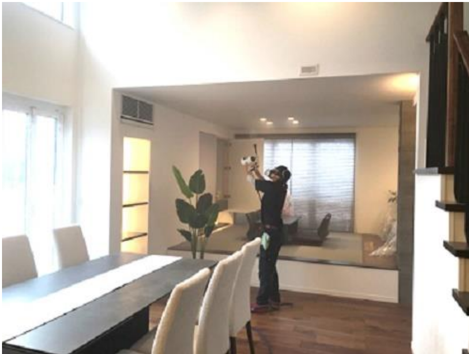
抗ウイルス抗菌コーティング(「レコナガード エアフレッシュ」) 住宅展示場への施工の様子